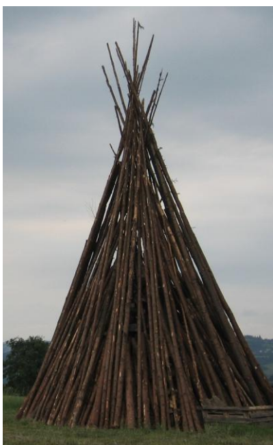
Zwei vorbildlich aufgebaute Johannisfeuer im Landkreis Kronach

Für weitergehende Informationen stehen Ihnen die Mitarbeiter des Landratsamt Kronach (Tel. 09261 / 678-376 und -291) gerne zur Verfügung.