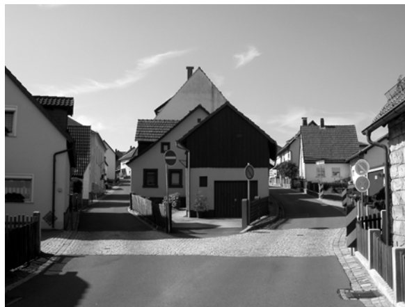
Abb. 7 + 8: Blick von Gehülz auf das Straßenangerdorf Ziegelerden mit der St.-Michaelskirche. Im Ortskern von Ziegelerden sind noch Tropfhäuser als historisches Dokument der Redwitzschen Peuplierungspolitik erhalten. Die Tropfhäuser sind vermutlich im späten 18. oder frühen 19. Jahrhundert erbaut worden. Aufnahmen 2004.