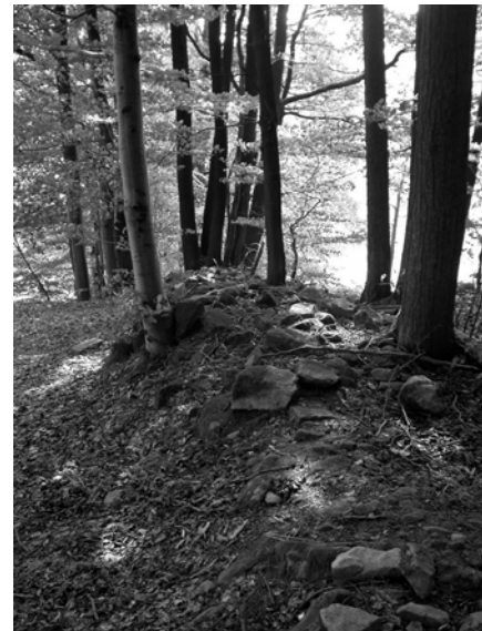
Abb. 28 + 29: Neuzeitliche Lesesteinwälle durchziehen die Befestigungsanlage der Heunischenburg. Aufnahmen 2004.