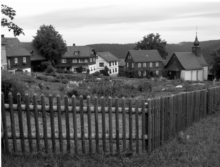
Abb. 19 + 20: Tanzplatz in Ebersdorf mit Angerhaus und Steinbach an der Haide mit seinem Angergarten. Aufnahmen 2004.

Schieferarbeiter, die noch zu dokumentieren sind, wie auch die Nebenbahnlagen mit ihren Brückenbauwerken und Bahnhöfen, die bedeutende verkehrsgeschichtliche Zeugnisse darstellen.