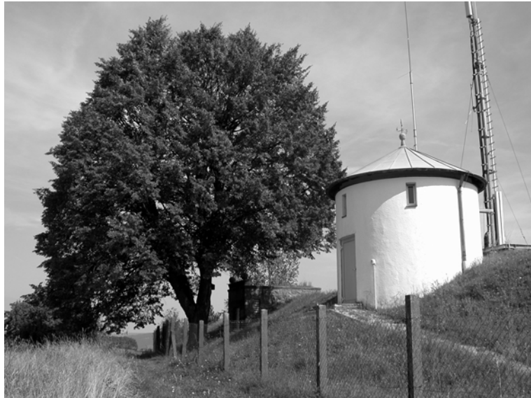
Abb. 26 + 27: Fußsteig in Richtung Einöde Gießübel mit einem Ruhstein (links unten). Das Bild rechts zeigt Wasserhochbehälter von 1931 und von 1961 auf der Brander Höhe. Ein Lindenbaum markiert diese landschaftswirksame Stelle. Aufnahmen 2004.