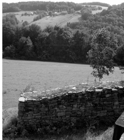
Abb. 22 + 23: Blick von Brander Höhe auf die Heunischenburg, eine Abschnittsbefestigung aus der spätbronzezeitlichen Urnenfelderkultur. Die Anlage wurde 1986/2000 teilweise rekonstruiert. Von der Heunischenburg eröffnet sich u. a. ein Blick auf den Skilift und den Weiler Judengraben. Aufnahmen 2004.

Rotschreuth (1348 urkundlich erwähnt) war 1399 als bischöfliches Burghutlehen an die von Schaumberg zu Mitwitz gekommen und gehörte bis Mitte des 19. Jahrhunderts zum Herrschafts- und Gerichtsbezirk Mitwitz, der Ende des 16. Jahrhunderts auf die von Würtzburg übergang. Das zu Seelach gehörende Heiligenholz ist der Überrest des „Cronacher Hayligholtzes“ (Kronacher Kirchenvermögen), das sich zwischen Seelach einerseits sowie Gießübel und Rotschreuth andererseits auf dem Höhenzug erstreckte.