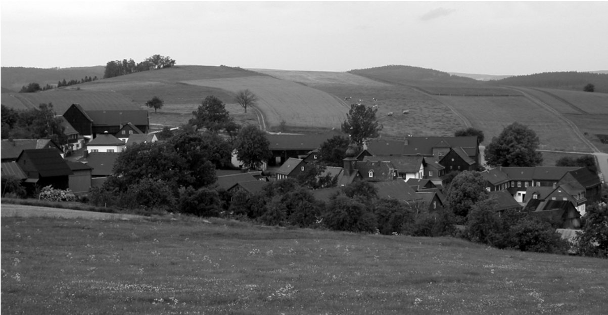
Abb. 30: Radialhufenflur Steinbach a. d. Haide im Landkreis Kronach. Aufnahme 2004.