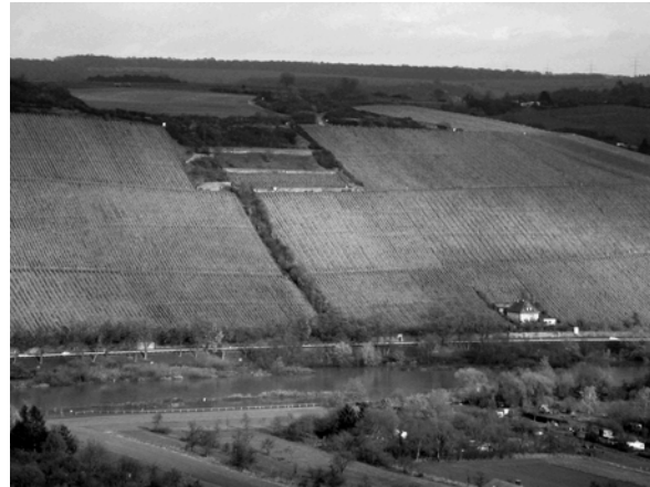
Abb. 1 + 2: Landleitenbach im Frankenwald mit gepflastertem Bachbett. Aufnahme 2004. Rebflurbereinigter Weinberg bei Würzburg. Aufnahme 2003.