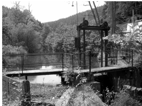
Abb. 11 + 12: Alte Gaststätte und Mühlbach des Stielers Hammer am Falkenstein im Loquitztal im Landkreis Kronach. Aufnahmen 2004.