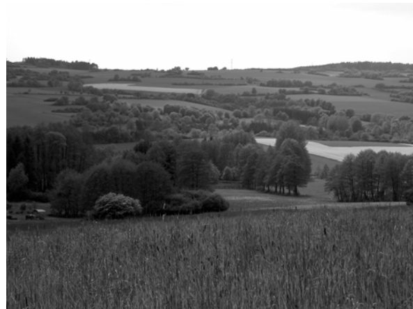
Abb. 15 + 16: „Heckenlandschaft“ auf dem Muschelkalkzug bei Seibelsdorf. Aufnahmen 2004.