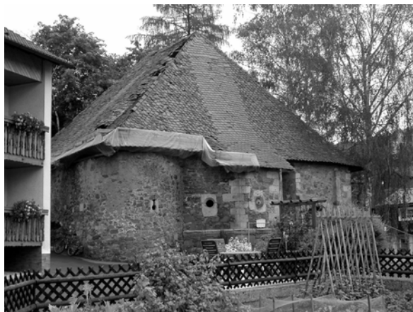
Abb. 17 + 18: Burganlage „Alte Wache“ der Herren von Redwitz in Theisenort und Burgruine derer von Würzburg in Rothenkirchen. Aufnahmen 2004.

bildet ist, nicht zuletzt die zahlreichen Wegkapellen und Martern sind eindrucksvolle Zeugnisse der religiösen Aufladung der Landschaft. Ein herausragendes Zeugnis der fränkischen Bierkultur ist der im Wald liegende Sommerkeller bei Ebneith von 1790. Hervorzuheben ist auch der aus festgestampftem Lehm bestehende Tanzplatz in Ebersdorf, umrahmt von alten Lindenbäumen. Das Brauchtum der dortigen Trachtenkirchweih lässt sich bis 1658 urkundlich zurückverfolgen. Auf der Südseite des Tanzplatzes steht das Angerhaus. Der untere Teil dieses Holzbaues dient als Schenkbude, der obere Teil als Musiktribüne. Ein einmaliges kulturgeschichtliches Zeugnis ist auch der Angergarten von Steinbach a. d. Haide, 1553 erstmals bezeugt. Während der nördliche Bereich überbaut wurde, dient der südliche Teil des Dorfgangers mindestens seit der 1. Hälfte des