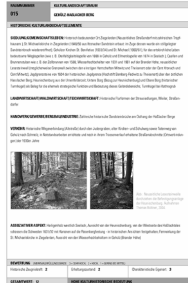
Abb. 4: Blätter 1, 2 und 5 des kulturlandschaftsräumlichen Steckbriefs Gehölz-Haßbacher Berg, erstellt durch Thomas Büttner.

elemente bewertet. Die Erfüllungsgrade der Kriterien ergaben addiert einen kulturhistorischen Zeigerwert in den Wertigkeiten geringe bis mittlere, hohe und sehr hohe kulturhistorische Bedeutung. Die Erfassung, Darstellung und Bewertung der Kulturlandschaftsräume erfolgte in Text- und Kartenform über die kulturlandschaftsräumlichen Steckbriefe sowie über die „Karte der Kulturlandschaftsräume“.