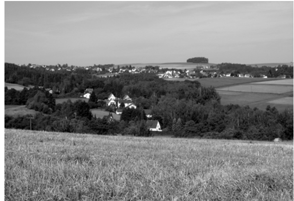
Abb. 24 + 25: Blick von der Rosenbergfestung Richtung Gehülz und Haßlacher Berge. Am Horizont ist das Heiligenholz (historischer Waldflecken) bei Seelach erkennbar. Auf dem Bild rechts geht der Blick (von links) über Unterentmannsdorf und Breitenloh Richtung Heiligenholz. Im Vordergrund Häuser des unteren Dobersgrundes. Aufnahmen 2004.

Ziegelerden und Breitenloh-Unterentmannsdorf als Straßendörfer planmäßig erweitert. Diese bis heute charakteristisch ausgebildeten Straßendörfer sind ein bedeutendes Zeugnis der Peuplierungspolitik der Freiherren von Redwitz, die Lohnarbeiter in Tropfhäusern ohne bzw. mit geringem Landbesitz (oftmals ohne Rücksicht auf agrarische und handwerkliche Tragfähigkeit) ansiedelten. In Ziegelerden finden sich noch zahlreiche Tropfhäuser als Zeugnis dieser Zeit. Bereits 1589 wurde in Ziegelerden eine Ziegelhütte am Trötschenberg, unmittelbar an der Grenze zur Stadt Kronach errichtet. Für die Ziegelherstellung wurde der tonhaltige Obere Buntsandstein verwendet. Die auf Geheiß der Theisenorter Schlossherrschaft gegründete Ziegelei bestand bis um 1780. Erst nach der Aufgabe der Ziegelei