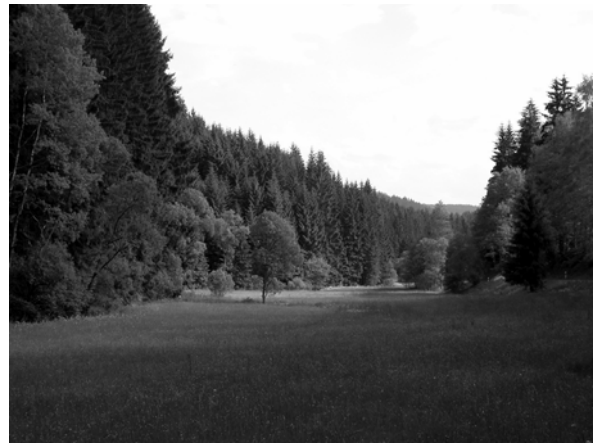
Abb. 9 + 10: Kirchweihflößen in Unterrodach und Talwiese bei der Wellesmühle im Landkreis Kronach. Aufnahmen 2002 und 2004.