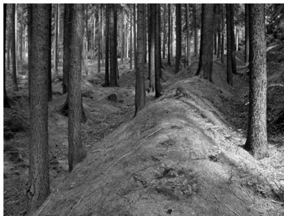
Abb. 13 + 14: Mit Schiefer verkleidete Wohnhäuser und Wirtschaftsgebäude in Ebersdorf im Landkreis Kronach. Auch für die Eindeckung der Kirchhofmauer sowie als Bodenplatten findet der Schiefer Verwendung. Das Bild rechts zeigt einen eingestürzten Stollenzug der Grube St. Wolfgang bei Stockheim. Aufnahmen 2004.

heute noch in Gestalt von Pingeln und abgesackten Stollengängen im Wald ablesbar sind. Mit dem technischen Fortschritt wanderte der Steinkohlebergbau in die tieferen Lagen und drang bis in 300 m Tiefe vor. Bedeutende Anlagen waren die Grube St. Katharina (1775 - 1968), der Vereinigte Nachbar, die Kreuzgrube (St. Wolfgang, 1766, Abraumhalde vorhanden). 1968 erlosch der Bergbau in diesem Gebiet. Die über 20 Steinkohlebergwerke im Stockheimer Raum förderten 120 Millionen Zentner Kohle. Von den baulichen Anlagen sind, neben dem nicht zugänglichen weit verzweigten Stollensystem, noch einzelne Bestandteile wie z. B. das Adam-Friedrich-Zechenhaus von 1771 oder die alte Rentei der Katharinenzeche erhalten. Als Synergieeffekt zum Stein-