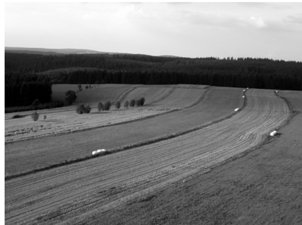
Abb. 5 + 6: Radialhufenflur Birnbaum. Aufnahmen 2002.